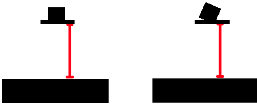
Figura 3: Ejemplos de medición de distancia con respecto a las marcas

Como fue mencionado antes, el robot puede ignorar las marcas.